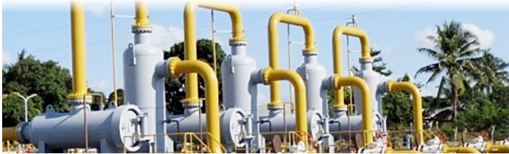
Mitambo ya kusafirisha gesi.