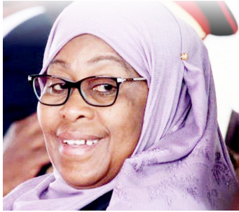
Rais Samia Suluhu Hassan

B AADA ya Tanzania kupata kiongozi wake wa kwanza mwanamama, Rais Samia Suluhu Hassan, idadi kubwa ya wanawake wanatamani kufika alipo.