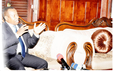
Makamu wa Kwanza wa Rais wa Zanzibar Othman Masoud Othman