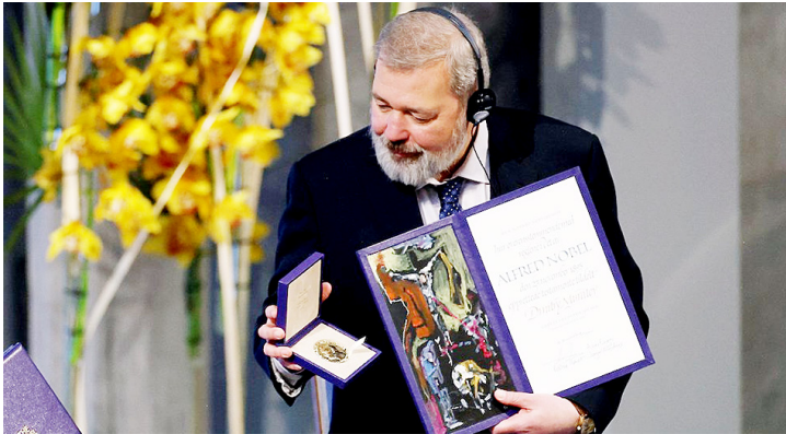
Dmitry Muratov, Mhariri wa gazeti la Novaya Gazeta, akiwa na nishani yake ya Nobel

D mitry Muratov, mshindi mwenza wa Tuzo ya Amani ya Nobel ya 2021 na mhariri wa gazeti la Novaya la Urusi, ameamua kupiga mnada nishani yake kwa Sh. bilioni 240 (dola za Marekani 103.5 milioni) ili kusaidia watoto walioathiriwa kwa vita nchini Ukraine.