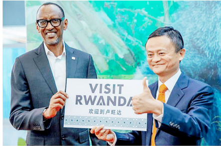
Rais Paul Kagame wa Rwanda akiwa na Jack Ma

Tayari chuo hicho kimetangaza katika tovuti yake kwamba Ma atakuwa miongoni mwa wakufunzi wanaotarajiwa kuanza kutoa mafunzo ya biashara