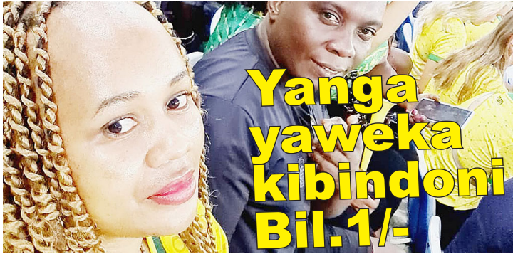
Baadhi ya mashabiki wa Yanga wakifurahia timu yao kutinga hatua ya nusu fainali.