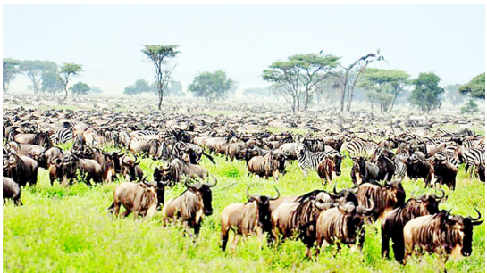
Wanyamapori ni vivutio vya utalii Wanyamapori ni vivutio vya utalii

Kwa hiyo jamii ikibuni na kutekeleza programu za kiuchumi na kijamii zinazowaongezea vijana fursa zinazowapa sababu ya kuepuka tabia za kihalifu kwa sababu kuna fursa bora zaidi zisizoambatana na uhalifu, uhalifu utapungua.