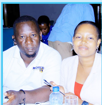
Baadhi ya waandishi wa habari walioshiriki katika semina ya mafunzo kuhusu namna bora ya kutangaza vivutio vya Tanzania