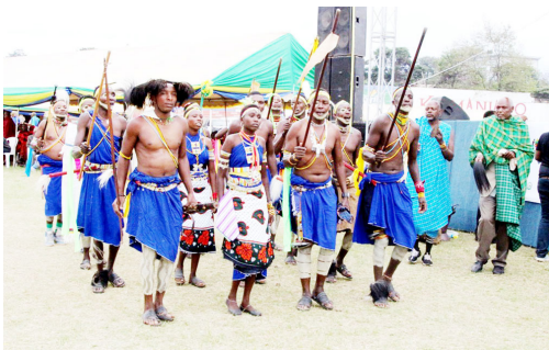
Utamaduni chanzo cha kuvuta watalii

Hapa, utamaduni ni ‘kipengele kikuu cha kuvuta’ ambacho huathiri uamuzi wa awali wa mgeni kusafiri hadi sehemu mbalimbali za dunia. Tuutangaze utamaduni wetu.