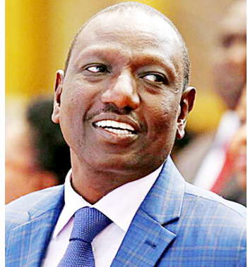
Mgombea urais wa Kenya, William Ruto

Ruto alidai kuwa kuna ushirikiano mbaya kati ya serikali na viongozi wa Azimio kuipiga vita IEBC na mwenyekiti wa tume hiyo, Wafula Chebukati, “baada