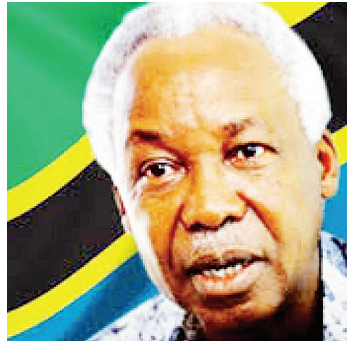
Hayati Baba wa taifa Julius Nyerere

Mara nyingi tunachukulia mambo kwa urahisi. Ni vyema kukumbuka kuwa kuna mambo makubwa katika maswali rahisi. Vumbuzi kubwa zimesimama katika maswali rahisi na Biblia inatukumbusha