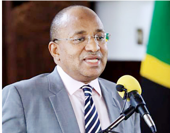
Rais wa Serikali ya Mapinduzi Zanzibar, Hussein Mwinyi.