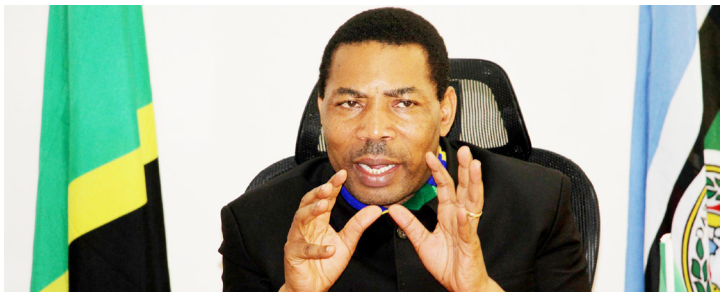
Waziri wa Fedha, Dkt. Mwigulu Nchemba

Ni wakati muafaka sasa kwa serikali kuja na utaratibu mzuri wa kupunguza ukali wa maisha kwa kupunguza kodi nyingi na tozo – umiza zinazolalamikiwa na wananchi.