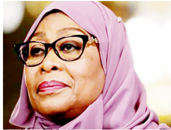
Rais Samia Suluhu Hassan

Wanaliza, kama lengo ni kukusanya kingi kwa maendeleo makubwa, kwanini