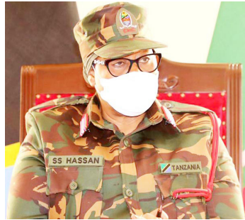
Rais Samia Suluhu Hassan

Kwa huku nchi za Magharibi, suala la haki-jinai limekuwa miongoni mwa vipaumbele vikubwa katika siku za hivi karibuni. Nchini Marekani, mhalaki Kim Kardashian, amekuwa mmoja wa wanaharakati wa haki jinai, hususan