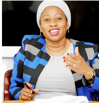
Wasiri wa Afya, Ummu Mwalimu

Pia kuna Mfuko wa Mafao ya Afya ya Jamii (SHIB), unaohudumia asilimia 0.1 ya wagonjwa watu wote, huduma zake zikipatikana kupitia Mfuko wa Pensheni wa Taifa (NFFS); Mfuko wa Bima Binafsi