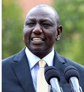
Rais William Ruto

Wachambuzi wa siasa na wale wa maudhui ya vyombo vya habari wameeleza kuwa magazeti makubwa, vituo vya televisheni vinavyoaminika, vilimpa upendeleo Raila kwa kuamini kuwa atashinda uchaguzi huo.