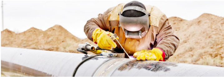
Bomba la mafuta