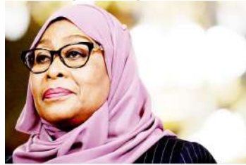
Rais Samia Suluhu Hassan

imeshuka baada ya Mwalimu kuondoka. Walioishusha wasiigane.