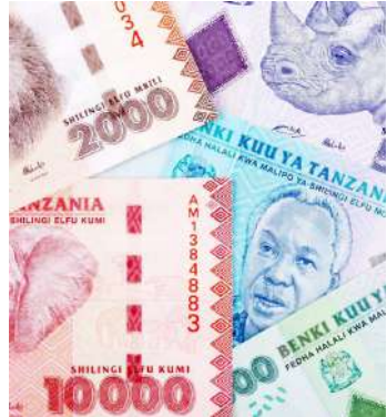
Pesa za mfano

Mwandishi nguli wa Marekani Sidney Sheldon, katika kitabu chake maarufu "If Tomorrow Comes," anasema mtu hawezi kutapeliwa kama siyo mzembe na hana tamaa ya utajiri wa haraka!