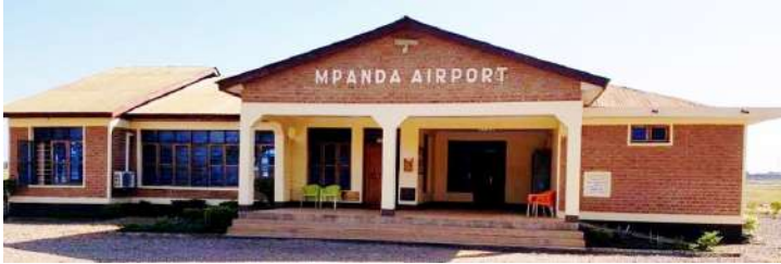
Uwanja wa Ndege wa Mpanda