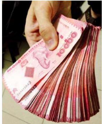
Mfano wa Pesa

Isivyokuwa bahati, dunia ya sasa inalazimisha uelewa kuwa siyo suala