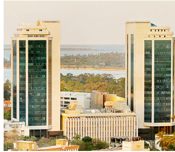
Jengo la Benki Kuu ya Tanzania

Kihistoria, Pride ni kampuni iliyooanzishwa Mei 5, 1993 kwa ajili ya kukuza maendeleo ya vijijini kwa njia ya kuanzisha na kuhami kifedha miradi ya