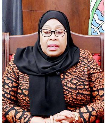
Rais Samia Suluhu Hassan

Katika tukio la pili, Oktoba 18 iliripotiwa kuwa Waziri Mkuu Kassim Majaliwa alikagua ujenzi wa hospitali ya wilaya ya Namtumbo na kutoridhishwa na “utendaji wa ovyo.” Waziri Mkuu alinukuliwa akisema, “nimekagua ujenzi wa hospitali ya wilaya lakini, sijaridhishwa na hali ya ujenzi, nimeagiza milango yenye hitilafu yote ing’olewe na iwekwe yenye hadhi ya hospitali ya wilaya, iweje iwe imeacha nafasi juu hadi