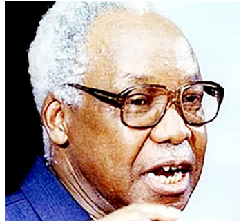
Mwl. Julius Nyerere

Wapo waliopanda majukwaani, tena wakizungumza na povu likiwatoka midomoni mwao; kwamba Kiswahili lazima kipiganiwe kwa nguvu zote ili