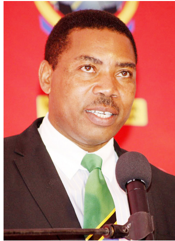
Waziri wa Fedha na Mipango Mwigulu Nchemba