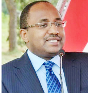
Dkt. Hussein Ali Mwinyi

Hakujawa na taarifa ya kuwa FBME ilifilisika na tangu wakati huo hakujatolewa taarifa rasmi ya kilichotokea zaidi ya fununu kuwa benki ilifungwa ili kuridhia matakwa ya mataifa