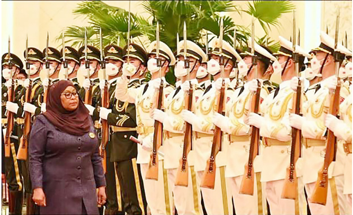
Rais Samia Suluhu Hassan akikagua gwaride aliloandaliwa wakati wa ziara yake China.

K ATIKA kile kinachoweza kuelezwa kuwa ni kuhangaikia Watanzania, Rais Samia Suluhu Hassan hapumziki; yuko huku na kule kusaka “ugali wa watoto ” na Novemba 2, mwaka huu, alisafiri hadi China na kukutana na kiongozi wa nchi hiyo tajiri, Xi Jinping mjini Beijing.