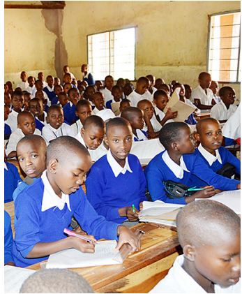
Wanafunzi wakiwa darasani

Ukiangalia kijuujuu unaweza kudhani huu ni mfumo usio na maswali mengi, lakini sivyo. Katika kipindi chote mwanafunzi anapokuwa shuleni hufanyishwa mitihani mingi kupima uwezo wake. Baadhi ya mitihani hiyo