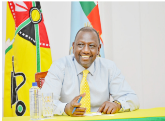
Dkt. William Ruto

Kiongozi huyo wa chama cha upinzani alishutumu Mahakama ya Upeo