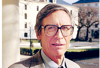
Profesa John Rawls

Mosi, Rawls anaongelea kanuni ya uhuru sawa kwa raia wote. Kwa mujibu