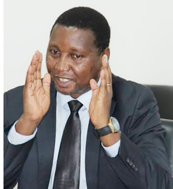
Wasiri wa Elimu - Prof. Adolf Mkenda

Hili huenda sambamba na kuwatafuta wakukuzi (hackers) wa nchi mbalimbali wanaojaribu kuingia ndani ya mifumo mbalimbali ya nchi hiyo. Haya yote husababishwa na kiu waliyonayo wenzetu katika kukuza na kulinda ufahamu wao wa sayansi na teknolojia.