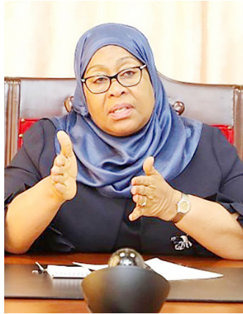
Rais Samia Suluhu Hassan

“Hivi wewe uliwahi kusikia wapi inatangazwatangazwa kwamba mawaziri wanakutana – tena kwa dharura na