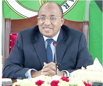
Dkt. Hussein Ali Mwinyi

Wakati wa pilikapilika za uchaguzi ule, wapo baadhi ya watu wanadaiwa