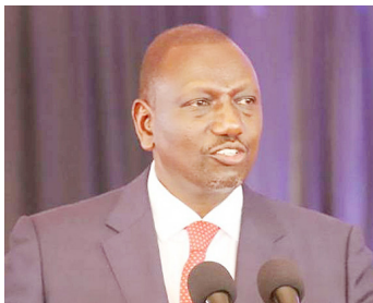
Dkt. William Ruto

Ijapokuwa chama hicho kilikuwa katika muungano wa Azimio la Umoja, viongozi wake walidai kuwa