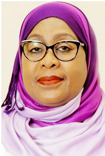
Rais Samia Suluhu Hassan

Taarifa zinasema, asilimia 60 ya umeme unaosambazwa na Tanesco nchini unatokana na gesi inayozalishwa SongoSongo, mkoani Lindi na Mnazi Bay, mkoani Mtwara.