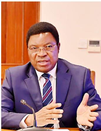
Waziri Mkuu, Kassim Majaliwa

Alisema hivi sasa serikali imeweza kuunganisha mifumo ambayo itarahisisha zaidi namna ya kufuatilia utendaji na