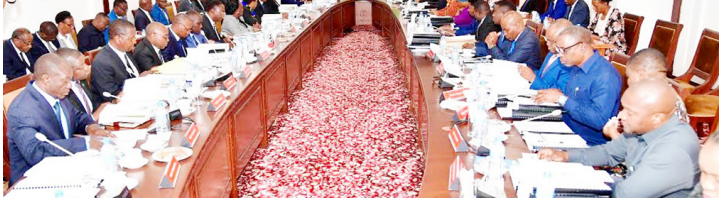
Baraza la Mawaziri kikaoni

ukosefu huo na watu bado wanateseka, tega sikio tu, utanisikia jioni,” amesema.