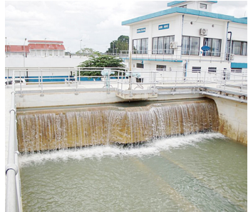
Maji ya to Ruvu

Anasema, serikali inapaswa kuchukulia kukosekana kwa maji kama vita, kwamba inapaswa “kupigana kwa silaha zote ili