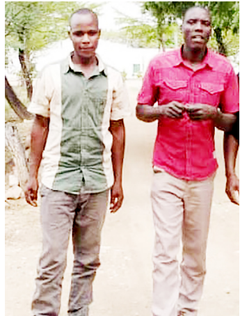
Katala akiwa na Ng'hulima

haikumtaja huyo aliyebakwa wala hakuitwa mahakamani kutoa ushahidi. Aliwasilisha ushahidi wake kwa maandishi kwa kile kilichoelezwa kwamba ni kumlindia utu wake. Mahakama ya Hakimu Mkazi Bariadi ikawahukumu kifungo cha maisha jela.