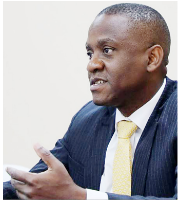
Mkurugenzi Mkuu Tanesco, Maharage Chande

Ili kubaini mtazamo wa CCM kuhusu tatizo hilo, jiulize swali hili - “lini umemsikia kiongozi wa ngazi za juu