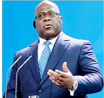
Rais wa DRC Felix Tshisekedi

Maaskofu hao pia wamelaani “unafiki wa jumua ya kimataifa” kwa madai kwamba wanaziacha huru Rwanda na Burundi zinazosababisha matatizo haya, na badala yake kuawaweka vikwazo waasi