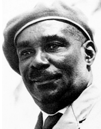
Abeid Amani Karume

Ikumbukwe kuwa Zanzibar katika kujiunga kwake UN, hakuna mwanachama wa umoja huo aliyepinga tangu kuanza kwa mchakato wake kwenye Baraza la Usalama (Security