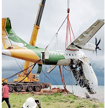
Ndege ya Precision ikiopolewa siwani

ambayo inaeleza kulipwa asilimia 31 – ikiwa ni ile kutoka Tanzania, wakati zote zinazotoka Ulaya na Amerika zinataka kulipwa asilimia 33.