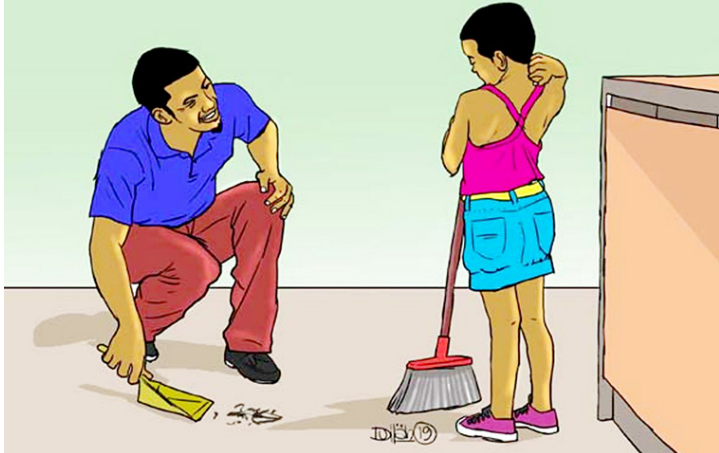
Msazi akifundisha mtoto namna ya kufagia. Katuni ya The Citizen.