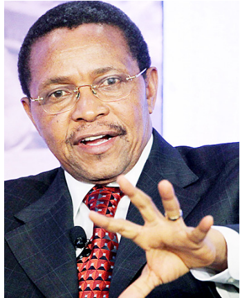
Dr. Jakaya Kikwete

Kwanza, nakumbusha kuhusu “tunu za msingi,” kama vile: hadhi ya ubinadamu, uhai, afya, elimu, michezo na burudani, urazini timamu, urafiki na haki. Na pili, nakumbusha kuhusu “tunu za mpito,”