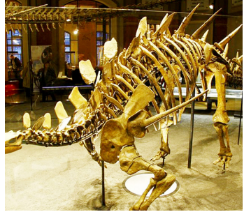
Mifupa ya mjusi mkubwa kutoka Tanzania anayehifadhiwa Berlin, Ujerumani na kuwa kivutio cha utalii

Mifupa ya mjusi huyo iliyoungwa kitaalamu, imemfanya kuwa na urefu unaokadiriwa kufikia mita 13.7 kwenda