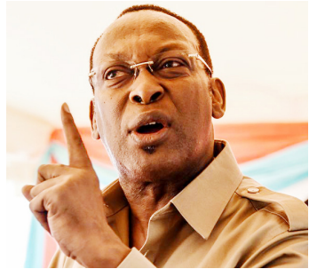
Freema Mbowe, kiongozi wa upinzani

Nadharia hizo zinaweza kuwekwa katika hatua tatu za mabadiliko ya kifikra,