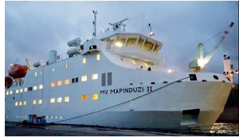
MV Mapinduzi II

Anaulizwa kiongozi haoni kuwa kuweka nguvu kubwa kwa wale wanaochukua rushwa ndogo serikali inachelewesha azma ya kukomesha ufisadi mkubwa kwa vile hata wananchi wataona hakuna umakini katika