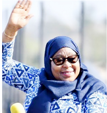
Rais Samia Suluhu Hassan

Wanafunzi wa Chuo Kikuu cha Nairobi, waliongoza wanafunzi wengi