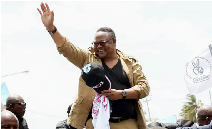
Aliyekuwa mgombea urais wa Tanzania 2020 kupitia Chadema, Tundu Lissu aliwasili Dar es Salaam, Januari 25, 2023 baada ya kuwa nje ya nchi kwa zaidi ya miaka miwili. Aliondoka Tanzania kwa hofu ya usalama wake. Lissu ni makamu mwenyekiti wa chama hicho cha ushindani.