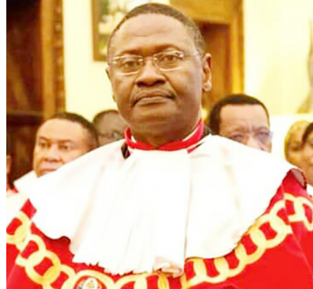
Jaji Mkuu wa Tanzania Prof. Ibrahim Juma

Bado hatujasahau mchakato wa kupata katiba mpya Tanzania ulivyokwenda