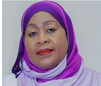
Rais Samia Suluhu Hassan

“Ninasherehekea siku yangu ya kumbukumbu ya kuzaliwa kwangu na Mheshimiwa Mama Rais Samia Suluhu. Ninatamani siku moja kwa mwaka huu kuzungumza naye kuhusu masuala yanayogusa afya katika ukanda wa SADC. Nitafarijika zaidi ikiwa hili litafanyika. Heri kwa siku yako ya kuzaliwa. Heri kwangu pia kwa siku ya kuzaliwa.”