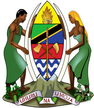
Nembo ya Taifa

Hapa ndipo tunaingia katika upimaji wa dhana mbili muhimu katika kujua umiliki wa taifa. Dhana hizo ni demokrasia na uwajibikaji.