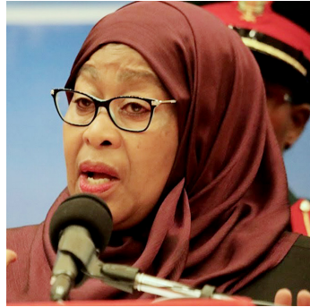
Rais Samia Suluhu Hassan

Sababu iliyonifanya nitamani kungekuwa na njia mbadala za kufanya mkutano huo ni taarifa kwamba deni la