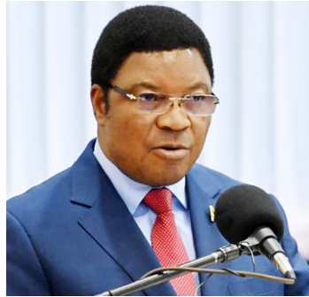
Majaliwa Kassim Majaliwa,

Maeneo hayo ni yale yanayothibitika katika vitabu vya Mkaguzi Mkuu wa Hesabu za Serikali (CAG) kwamba kuna wizi mkubwa wa fedha za walipakodi wa Tanzania na hata zile zinazoletwa kwa njia ya mikopo na hata misaada kutoka