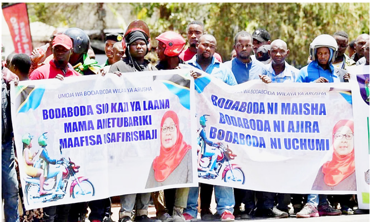
Baadhi ya wachuuzi wa usafiri wa pikipiki (Bodaboda) wa maeneo ya Usa River, Arusha wakiwa na mabango yenye ujumbe kwa Rais Samia Suluhu Hassan wakati alipokuwa akihutubia wananchi wa eneo hilo jana. (Picha na Ikulu).