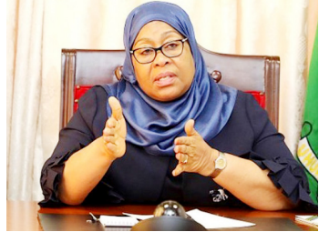
Rais Samia Suluhu Hassan

Mmoja alijiona ni msomi wa mwisho na hivyo hawezi kuelekezwa na kada tu wa chama asiyejua menejimenti ya wizara. Lakini, mwingine alijiona kuwa ni