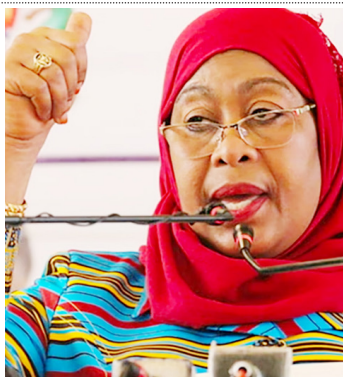
Rais Samia Suluhu Hassan

Sheria zetu ya uchaguzi zimekuwa zikilalamikiwa sana na wadau mbalimbali