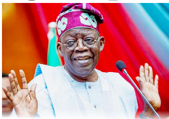
Rais Bola Tinubu

“Tuna ushahidi kwamba tulishinda uchaguzi huu. Tunaamini kuwa INEC