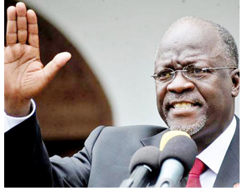
Hayati John Pombe Magufuli.