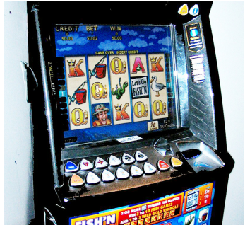
Mashine ya kamari