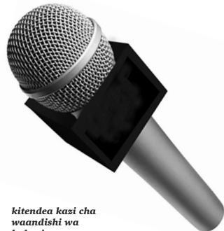
Kitendea kazi cha waandishi wa habari

Kwa wachambuzi wa masuala ya habari, inashangaza vipi waziri mhusika aliyeahidi hadharani kuhahikisha uhuru wa habari unalindwa kisheria, ameibuka na mapendekezo ya kuboresha Sheria ya Huduma ya Habari yenye vigingi licha ya serikali kuongozwa na rais mwenye upeo na dhamira chanya kuhusu sekta hiyo?