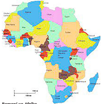
Ramani ya Afrika

Kulingana na ushahidi wa kimaandishi, Musa ambaye alizaliwa kutoka kabila la Lawi, alikolewa kimiujiza na dada yake