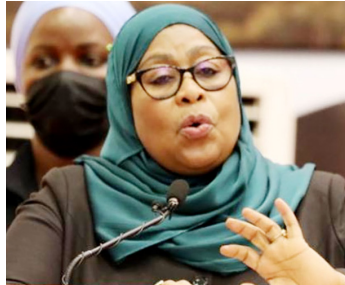
Rais Samia Suluhu Hassan

Hali hii huwaweka watetezi wa haki wote kuwa tayari kutukanwa na kudhalilishwa wakati wowote. Udhaliishaji wa watetezi unahitaji kujengewa mnara wa kumbukumbu kwa