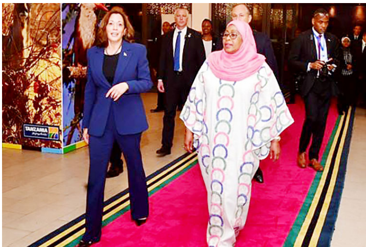
Rais Samia akiwa na Makamu wa Rais wa Marekani, Kamala Harris wakati wa kuingia kwenye dhifa ya kitaifa aliyomwandalia mgeni wake. Harris alikuwa Tanzania kwa ziara rasmi