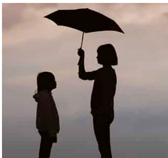
Tabia njema huansa kujengwa tangu utotoni

Zaidi ya hayo, kizazi kibovu hakitengenezi kizazi kibovu tu, bali pia hakiwajengei kizazi kipya uwezo wa uchaguzi mzuri juu ya tabia zao. Inahitajika tabia nzuri kujenga tabia nzuri. Nini kifanyike ili kufanikisha mpango wa utengenezaji wa watu wenye