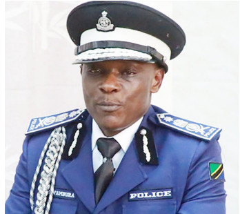
Mkuu wa Jeshi la Polisi, Camillus Wambura