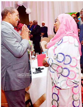
Rais Samia akibadilishana mawazo na Rais (mstaafu) Jakaya Kikwete