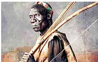
Mmoja wa wazee wa kisukuma

Walipofika kwenye himaya ya mtemi wakiwa salama, walimkuta Mwanamalundi amemaliza kula chakula chao na anaondoka. Ilibidi mtemi