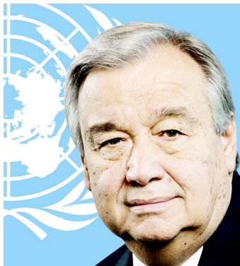
Katibu Mkuu wa Umoja wa Mataifa (UN), Antonio Guterres

Majeshi hayo, yanaonekana kukaidi kuheshimu mwito wa Katibu Mkuu wa Umoja wa Mataifa (UN), Antonio Guterres na Waziri wa Mambo ya Nje wa