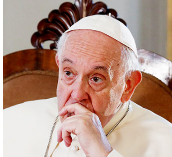
Kiongozi wa Kanisa Katoliki Papa Francis

Nabii Isaya kwa mfano, mara kadhaa aliwaonya wafalme wa Yuda juu ya mienendo yao katika uhusiano wa kimataifa. Wakati taifa la Yuda likiwa katika kilele cha mafanikio ya kiuchumi na kujizolea sifa nyingi, polepole tangu mwaka 745 K., taifa la Assiria chini ya mfalme Tiglat – Pileser lilianza kuvamia mataifa mengine na kuyazingira.