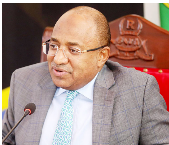
Rais Dkt. Mwinyi

Wachambuzi hao, wengi wakiwa wataalamu wa uchumi, siasa na maendeleo ya jamii, “wameweka wazi” kwamba Rais wa Zanzibar, Dkt. Hussein Ali Mwinyi ameonyesha dalili za kupigania maendeleo hayo kwa kuunganisha makundi mawili makubwa ya wanasiasa wa nchi yake.