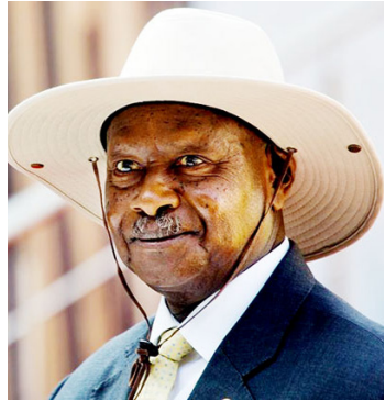
Rais Yoweri Kaguta Museveni wa Uganda

Zaidi ya miaka kumi baada ya kugundulika kwa kiasi kikubwa cha mafuta katika ziwa hilo, hakuna uzalishaji ulioanza kutokana na kuwepo kwa hofu