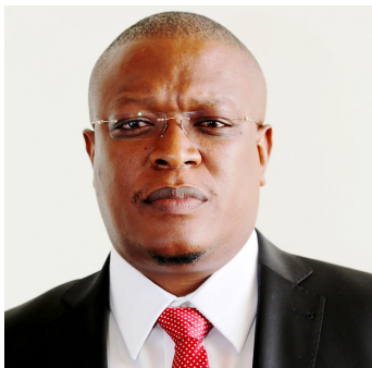
Waziri wa Habari, Nape Nnauye

Haja kutoharakishwa mchakato wa marekebisho ya Sheria ya Huduma ya Habari ilisisitizwa pia na Mbunge wa