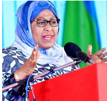
Rais Samia Suluhu Hassan sasa anafungua nchi.

Mradi huu una urefu wa jumla ya kilomita 1443 kati ya hizo kilomita 296