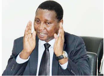
Waziri wa Elimu Prof. Adolf Mkenda

Somo la "Historia ya Tanzania na maadili" ni somo jipya tofauti na somo