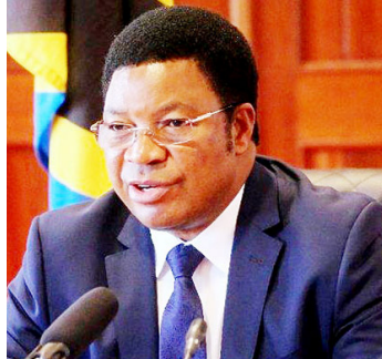
Wasiri Mkuu Kassim Majaliwa

Ikiwa ataendelea kwa muda mrefu, huyu mla rushwa, ni dhahiri kwamba ameiba kiasi kikubwa na amechangia kumfilisi; sasa kilichobaki