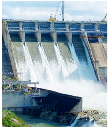
Sehemu ya Bwawa la Julius Nyerere

Ni wakati sasa wa serikali kuja na mpango wa kuimarisha shughuli za bandari kwa kuwekeza fedha zake yenyewe. Hakuna haja ya kuwa na hofu kuwa inaweza kushindwa kufanya hivyo