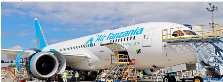
Ndege mali ya Serikali ya Tanzania