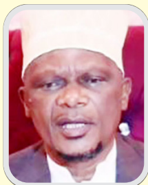
Sheikh Mkuu wa Tanzania Abubakar Zubeir bin Ally