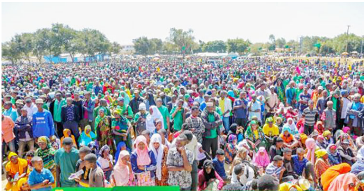
Umami wa wafuasi, wanachama na wananchi wakiwasikiliza vionogizi wa CCM wakati wakihutubia