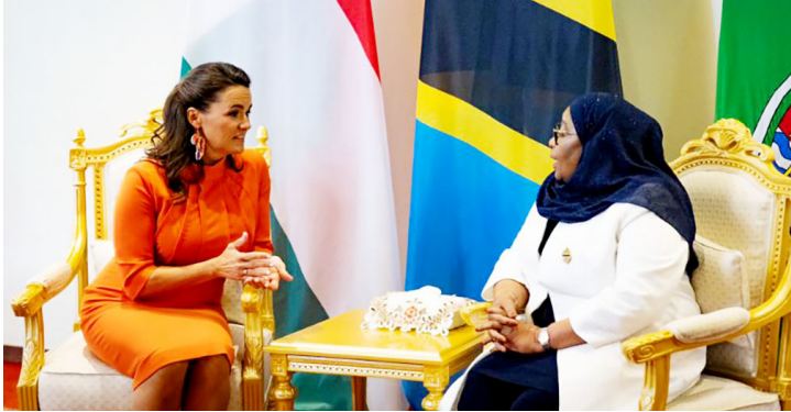
Rais wa Jamhuri ya Muungano wa Tanzania (kulia) Samia Suluhu Hassan akizungumza na mgeni wake, Rais wa Hungary, Katalin Novák - Ikulu, jijini Dar es Salaam 18 Julai, 2023. Rais Novák alikuwa nchini Tanzania kwa siara ya siku tatu.