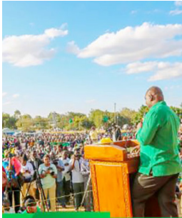
Katibu Mkuu wa CCM, Daniel Chongolo akihutubia wananchi jana katika viwanja vya Bombadier, Singida.

Chama hicho tawala kinaamini kwamba mkataba huo ni mzuri na utakapoanza kutekelezwa, Tanzania itanufaika zaidi kwa kupata kodi, ajira kwa wananchi na ujuzi kwa watendaji wazawa watakaokuwa wakifanya kazi bandarini.