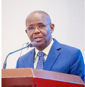
Wasiri wa Ujenzi na Uchukuzi Prof. Makame Mbarawa

2.9.5. Madhara Yanayowezekana kwa Nchi Yetu: Kifungu cha kufungia