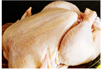
Nyama ya kuku

Katika hatua nyingine, imethibitika kuwa baadhi ya maeneo maalum ya kuchinjia kuku, yamekuwa yakipokea kuku waliochinjwa majumbani na wao