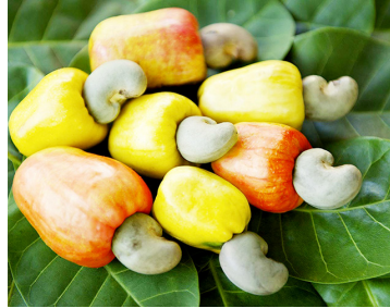
Zao la korosho

Hebu tuiangalie Msumbiji, tuachane na Nigeria na kwingineko, alikokutaja ili tuone maelezo aliyoyatoa yalilenga kutatua changamoto ya mkulima wa korosho ama yamelenga vitu vingine