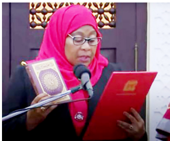
Samia akiapa kuwa Rais wa Tanzania

shukrani na kushindwa kutoa michango ya heri kwa watu “waliowashika mkono” wakati wa shida ama dhamna za maisha.