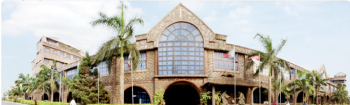
Kanisa la Soan