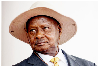
Rais wa Uganda - Yoweri Museveni

nimekuwa nikiwasilisha hili kwa sababu wafadhili hawawezi kutuunga mkono milele. Kweli, hivi majuzi, tulisikitishwa pale Pepfar ilipotangaza kujitoka, kukawa na majadala mzito kwenye baraza lao la mawaziri, "ameongeza.