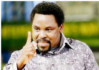
TB-Joshua