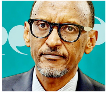
Rais Paul Kagame