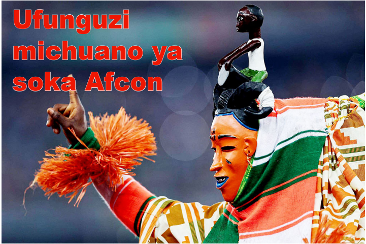
Kila aina ya mbwembwe zilishuhudiwa na dunia katika ufunguzi huo.