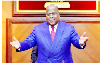
Rais Ndayishimiye

aliambia dunia kwamba, akichaguliwa tena atahakikisha anaishambulia Rwanda ili iache kusaidia waasi.