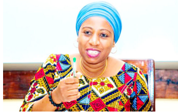
Waziri wa Afya, Ummu Mwalimu

Mara ngapi tunasikia wataalamu wa afya kutoka wizara hiyo anayoongoza Waziri Ummu wakieleza aina zaidi ya 800