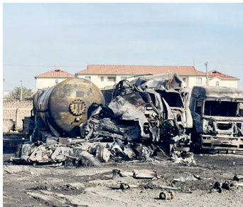
Mlipuko uliosababisha watu kupoteza maisha

Mwekezaji huyo anasema kuwa kinyume na taswira ambayo imeundwa kwamba yeye ndiye mfanyabiashara na mwekezaji katika gesi ya mitungi inayotumika majumbani kwa kutoa kawi ya upishi, hadi wakati wa mlipuko huo utokea, alikuwa akiendesha biashara ya