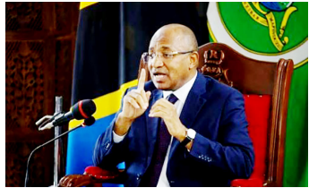
Rais Dkt. Mwinyi