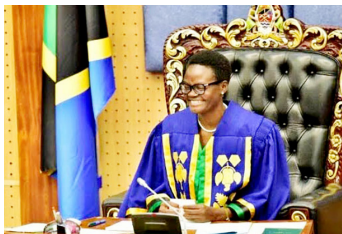
Spika wa Bunge Tulia Ackson

Katika mabadiliko ya sheria yaliyopitishwa na Bunge wiki iliyopita, mtu atakeyeongoza hiyo itakayoitwa