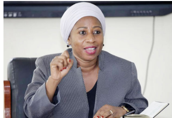
Waziri wa Afya - Ummu Mwalimu

India pamoja na madaktari wao bingwa wa tiba asili na mbadala wamezidiwa na hawa wa kwetu kitaaluma, au sisi hapa matabibu wetu wanatumia teknolojia na miujiza gani 'kuwaponesha' wagonjwa wa kisukari na BP?