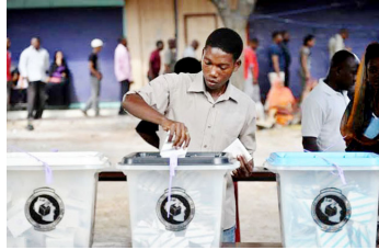
Masanduku ya kupigia kura

Kwanza, sheria inayounda tume inapaswa kuipa tume uhuru wake kamili wa kujitungia kanuni kwa kuwashirikisha wadau wa uchaguzi.