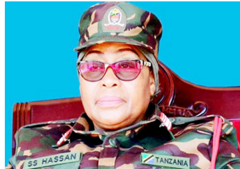
Rais wa Tanzania Samia Suluhu Hasan

wataangamiza wanajeshi wengi waliotumwa “kuwamaliza wao” hata kama wana nguvu kubwa kiasi gani katika vita.