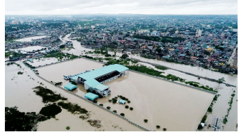
Mafuriko yanayosababishwa na kutowajibika kwa watendaji

Hata hivyo, binadamu kwa kutumia maarifa ya kisayansi ana uwezo wa kupunguza kiwango cha madhara ya