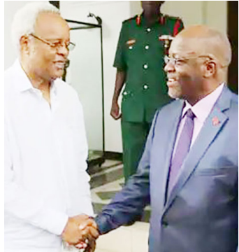
Edward Lowassa akisalimiana na John Magufuli (kulia) ambaye alikuwa Rais wa Awamu ya Ne ya Tanzania.

Ilivyo, watu wako wangependa pia wakuone umetinga suti na tai unapokutana na wageni wa kimataifa au kuhutubia mikutano ya kimataifa, kama ni mwanamme. Na kama ni mwanamke, basi, uvae vazi la kupendeza, na siyo