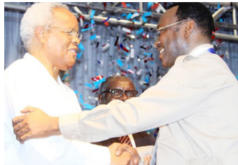
Edward Lowassa akisalimiana na Mwenyekiti wa Chadema, Freeman Mbowe (kulia).

Apumzike Kwa Amani, Edward Ngoyai Lowassa.