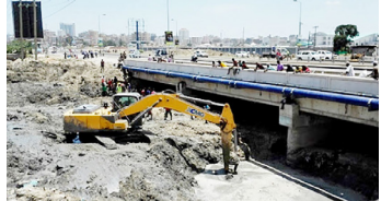
Mafundi wakhangaika na kuxibua kingo za Mto Msimbazi unaojaa maji kila mara

Hakuna anayeweza kuelewa kwamba wahandisi wetu wanasoma kanuni zilezile za ujenzi kama wa nchi nyingine,