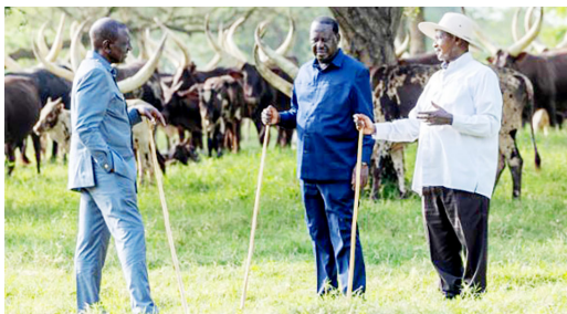
Rais Ruto -kushoto akiwa na Raila na Rais Museveni

Hata hivyo, Kenya ilishindwa na Chad iliyowakilishwa na mwenyekiti wa sasa, Moussa Faki Mahamat.