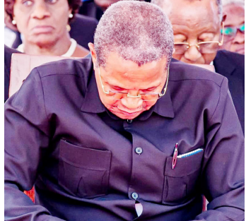
Rais mstaafu, Jakaya Kikwete