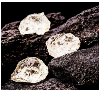
Madini ya lithium

mnyororo wa thamani wa kikanda kati ya nchi zinazolenga soko la magari ya umeme na nishati safi, ambayo inaweza kuleta faida ya mabilioni ya dola kwa nchi zote mbili.