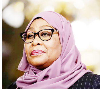
Rais Samia Suluhu Hassan

wa ndege ya mizigo (cargo), Tanzania ililazimika kuongeza zaidi ya Shilingi bilioni 110. (dola za Marekani milioni 49), ambazo hazikuwamo kwenye ankara wala mkataba wa awali.