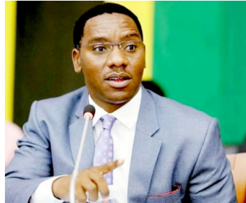
Paul Makonda, Mkuu wa Mkoa wa Arusha