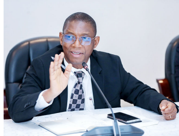
Gavana BoT - Emmanuel Tutuba

kushuka kwa mikopo, hivyo kupunguza kiwango cha matumizi kama vile ununuzi wa magari na ujenzi wa nyumba na hivyo kuyumbisha uchumi.