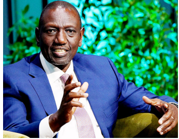
Kenya, Dkt. William Ruto

rais wa awamu ya pili, Daniel arap Moi na kujikuta akikomazwa na Raila wakati wawili hao walipokuwa kwenye chama kimoja cha Orange Democratic Movement (ODM).