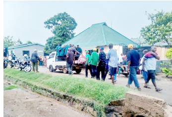
Mavazi ya CCM yakitawala mazishi

kiongozi wa Chadema, baada ya kufariki mzazi wake ambaye ni kiongozi wa CCM, wafuasi wao wakija msibani wamevalia vyuo kutambulisha vyama vyao, hali itakuwaje? Ni vurugu!