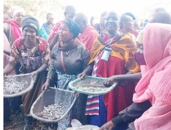
Wanawake wachekechaji wa mchanga kwenye machimbo ya Mererani wakimuomba Rais Samia kuwasaidia