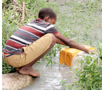
Kijana akichota maji

Rais Samia Suluhu Hassan alizitaka mamlaka za maji ziige mfano wa Shirika la Umeme Tanzania (Tanesco) kuweka mifumo itakayomuwezesha mteja