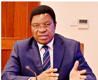
Waziri Mkuu Kassim Majaliwa

Kwa kuwa bado taasisi za serikali zinahitaji huduma za vyombo vya habari, ilitarajiwa kuwa taasisi ambazo zitatumia huduma hizo zitalipa huku zikiendelea kupunguza madeni ya awali.