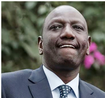
Rais wa Kenya, William Ruto

Viongozi wa Afrika waliyowahi kuhutubia Bunge la Marekani ni aliyekuwa Rais wa Liberia, Ellen Sirleaf Johnson mwaka 2006 na Rais wa zamani