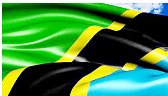
Bendera ya Tanzania

Sheria hizi za Muungano zilithibitisha Hati za Muungano, zilitaja Rais na