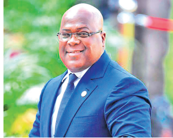
Raia Felix Tshisekedi