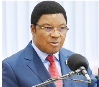
Waziri Mkuu Kassim Majaliwa

“Niwaombe wadau wote muhimu wakiwemo taasisi, asasi za kiraia na mashirika mbalimbali ya ndani na nje ya nchi washirikiane na vyombo vya habari