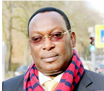
Freema Mbowe, kiongozi wa upinzani

“Bila mikutano vyama vya upinzani havina fursa ya kuishitaki serikali kwa wananchi wala kupata wanachama wapya. Hata sisi watu wa chama tawala, tutabweteka kiasi cha kupuuzia kwenda