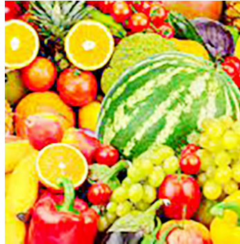
Matunda mengi ni tiba

Ikiwa kuna watu wamejaa hofu na uwoga – hasa wakati wa usiku ni vyema wakanywa chai ambayo ina majani ya