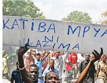
Hawa wanadai Katiba Mpya

Katiba ya nchi na sheria za Bunge ni walimu wazuri katika eneo hili, hata kama watachalewa kuingia darasani au watafundisha bila kueleweka kwa