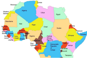
Sehemu ya ramani ya bara la Afrika

Fikiria, vijana wako wenye nguvu wanaamini watapata nyumba kwa kukesha kwenye makongamano, watajifunza lini kufyatua matofali ya kuchoma na kujijengea nyumba zao?