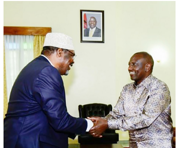
Rais Ruto akisalimiana na Miguna alipomkaribisha Ikuu, Nairobi kwa mazungumzo Jumamosi iliyoipita.

“Ombi la msamaha limechelewa sana, lakini ni vyema kwamba limefanyika sasa, hakika hakuna binadamu anayestahili