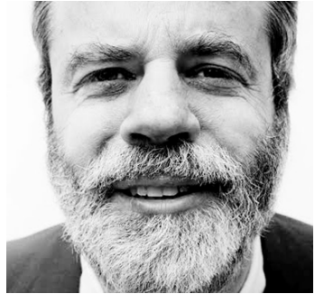
Prof. Saul Kripke

Kuna mikanganyiko kama hii kwenye siasa, uchumi, jamii, afya, elimu, mazingira na kwingineko. Mikanganyiko