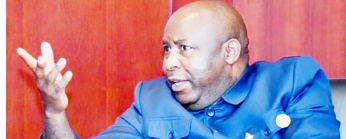
Rais Ndayishimiye

Mvutano huu mpya kati ya nchi hizo mbili jirani za Afrika Mashariki unakuja wakati ambapo Burundi inaelekea kwenye uchaguzi wa wabunge, useneta