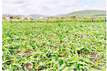
Mahindi yaliyofyeka kwa mbali na serikali huko Mpanda

ya ardhi, mijini hakutakiwi hata kufugwa kuku wala kulima mazao yoyote kama yale mahindi "yaliyofyeka kwa mbali" huko Mpanda!