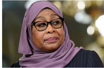
Rais Samia Suluhu Hassan

Kwamba mitambo mikubwa ya kuchapisha fomu za wagombea iwashwe; utumike umeme; walipwe watendaji; zinunuliwe karatasi, halafu ichapwe fomu moja tu.